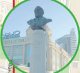
Памятник Л.Н. Гумилеву

15:00–16:00 Детский биг-бэнд п/у А.Мачнева, г.Ростов-на-Дону 16:15–17:15 Пианист «Уральского диксиленда» 16:35–17:15 «Уральский диксиленд», г.Челябинск