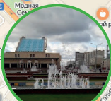
Сквер им. Габдуллы Тукая