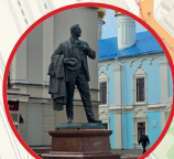
Памятник Ф.И. Шалапину