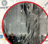
Дворец впечатлений 16:30–17:05 Dixie-Friends, г.Ростов-на-Дону