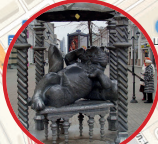
Памятник «Кот Казанский»

16:45–17:15 Группа «Раги-Ганги» (Индия) 17:15–17:50 Ансамбль п/у Ж.Сантоса (Бразилия) 17:50–18:30 Abelardo and Amigos (Куба) 18:30 ЗАКЛЮЧИТЕЛЬНЫЙ КОНЦЕРТ ДНЯ