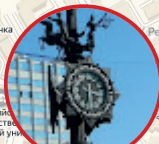
Монументальная декоративная композиция «Часы мира» 15:50–16:45 Городской женский джаз-оркестр «Фантазия», г.Казань 16:45–17:20 Easy Winners, г.Санкт-Петербург